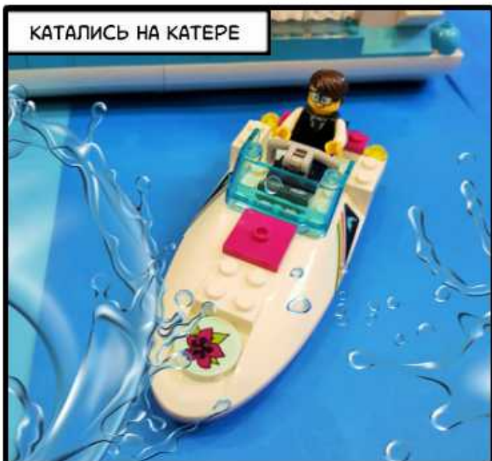
КАТАЛИСЬ НА КАТЕРЕ