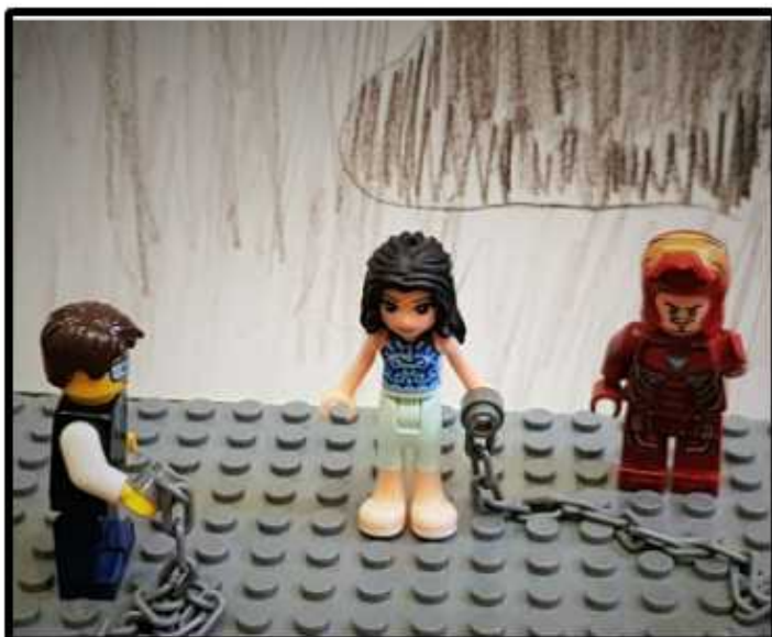
СНЯЛИ С НЕЕ ЦЕПИ И ,ЕЛЕ ДЫША, ВЫБЕЖАЛИ ИЗ ПЕЩЕРЫ