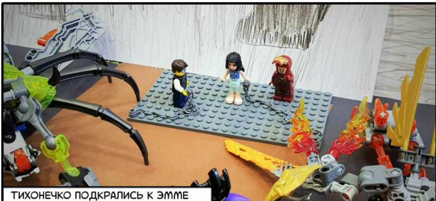
ТИХОНЕЧКО ПОДКРАЛИСЬ К ЭММЕ