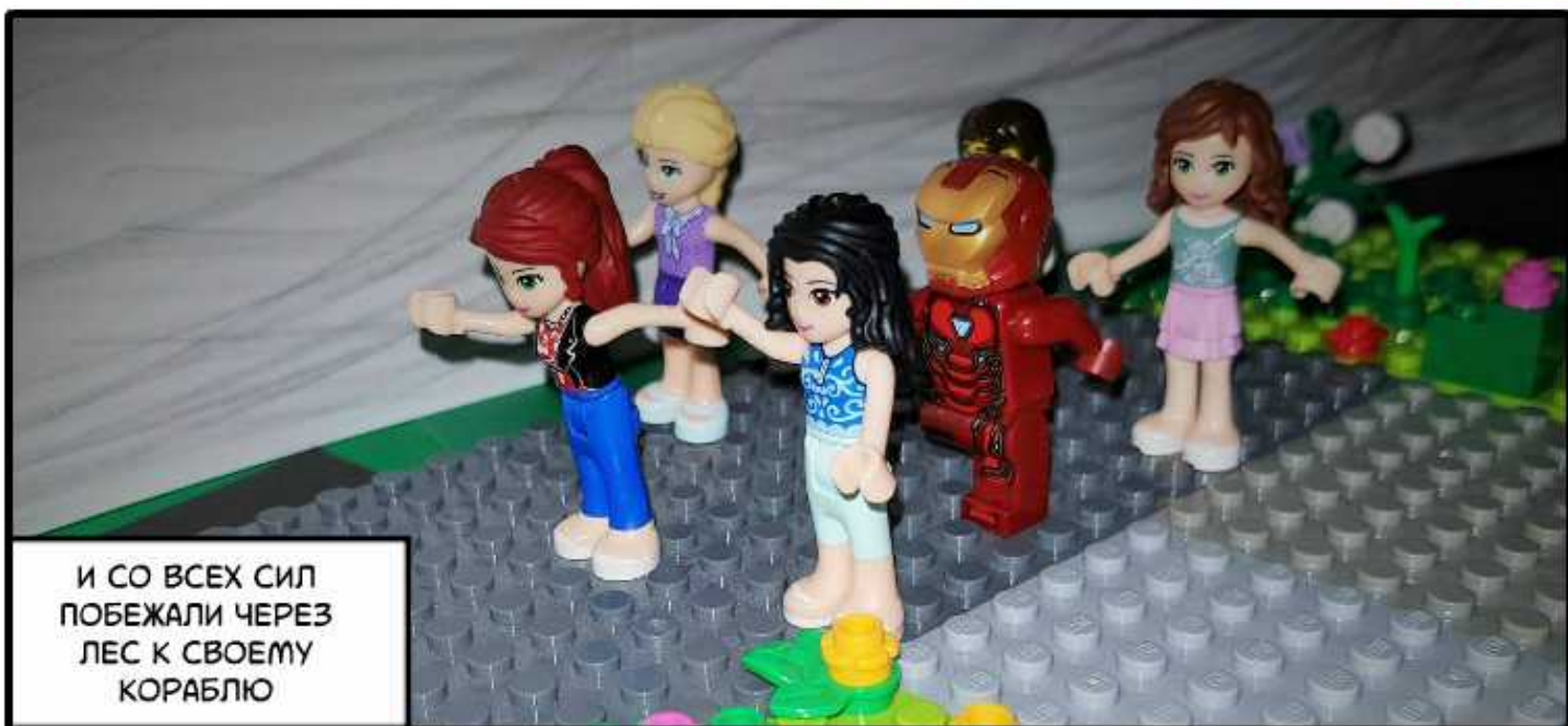
И СО ВСЕХ СИЛ ПОБЕЖАЛИ ЧЕРЕЗ ЛЕС К СВОЕМУ КОРАБЛЮ